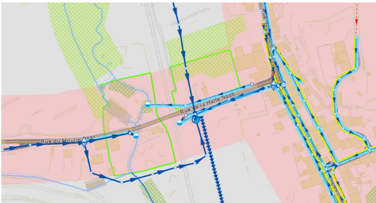
Figure 2- Localisation de la zone concernée par la modification du PASH (zone entourée en vert)