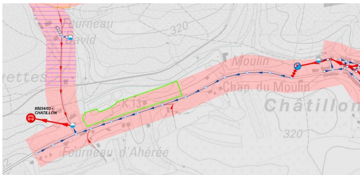
Figure 2- Localisation de la zone concernée par la modification du PASH (zone entourée en vert)