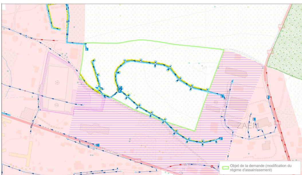
Figure 2. Localisation de la zone concernée par la modification du PASH (zone entourée en vert).