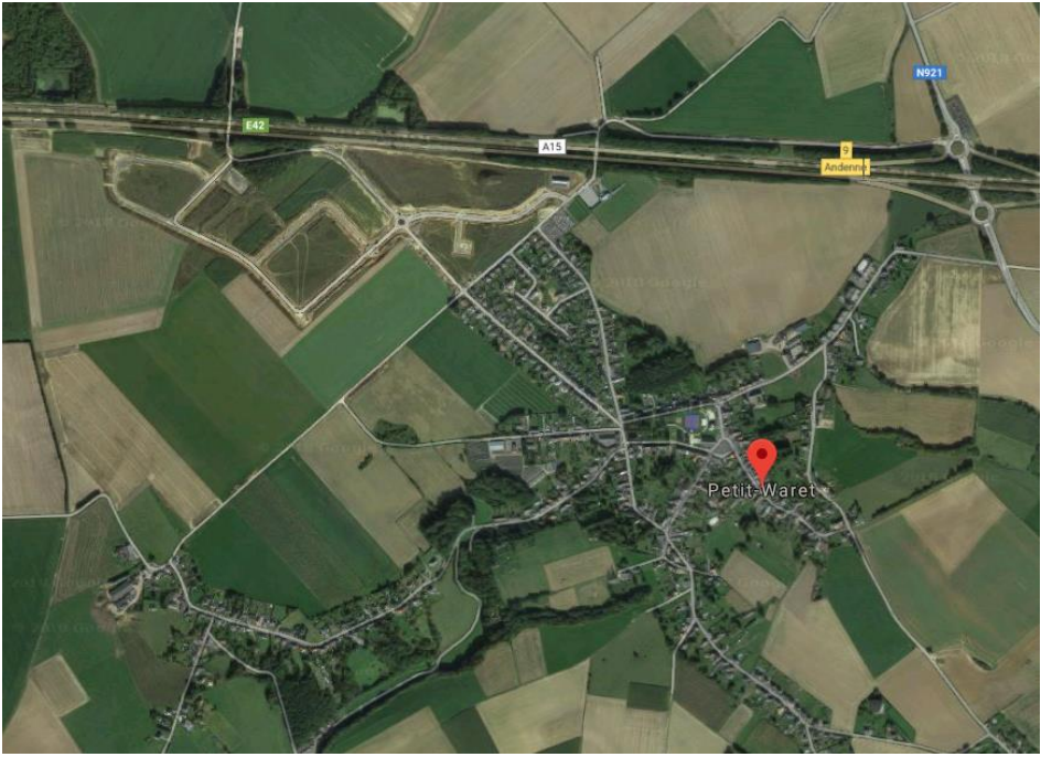
Situation actuelle au PASH