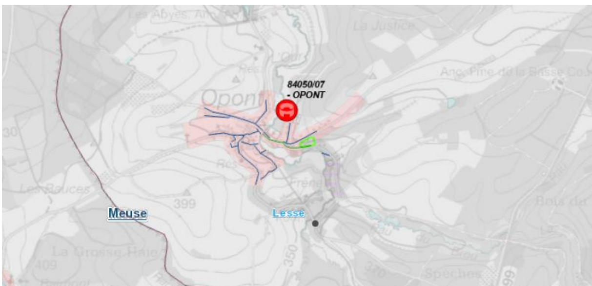
Figure 2 : Localisation globale de la demande (zone entourée en vert)